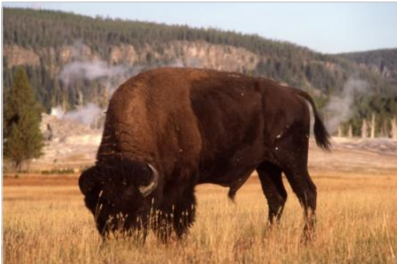
Bison grazing in Yellowstone National Park

Vzhledem k tomu, že účastníci budou mít několik možností pro všechny logistické záležitosti, pokryje si každá osoba svá vydání na dopravu a ubytování, jež si zvolí, včetně